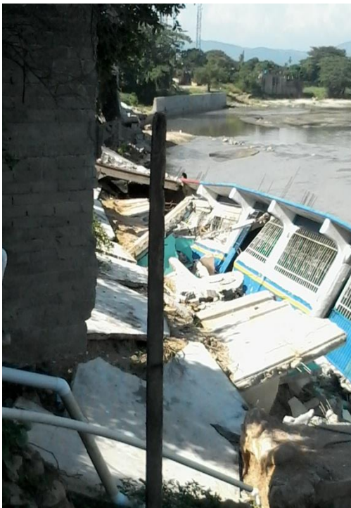
Sismo 21 de Agosto

La Dirección de Protección Civil ha emitido 7,285 Dictámenes de Afectación , derivados a las revisiones y solicitudes recibidas por los fenómenos Meteorológicos presentados, (Sismo del 21 de Agosto, y Tormenta Tropical “Manuel”)