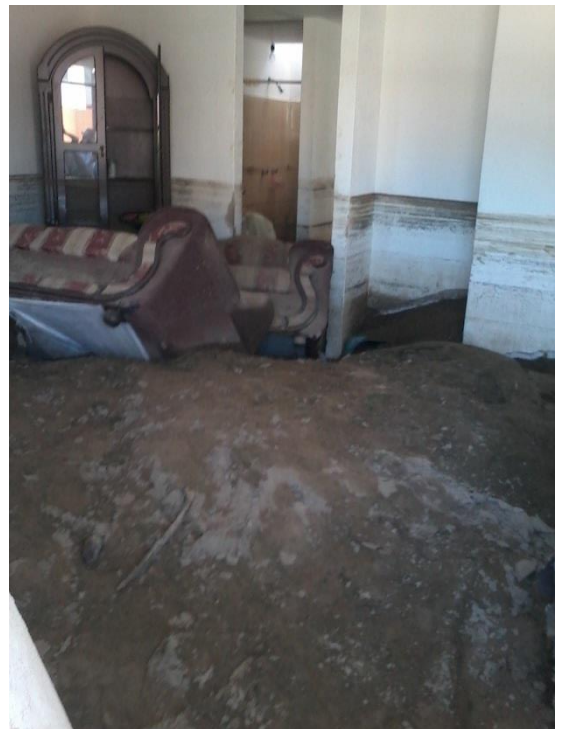
Inundación Tormenta “Manuel”